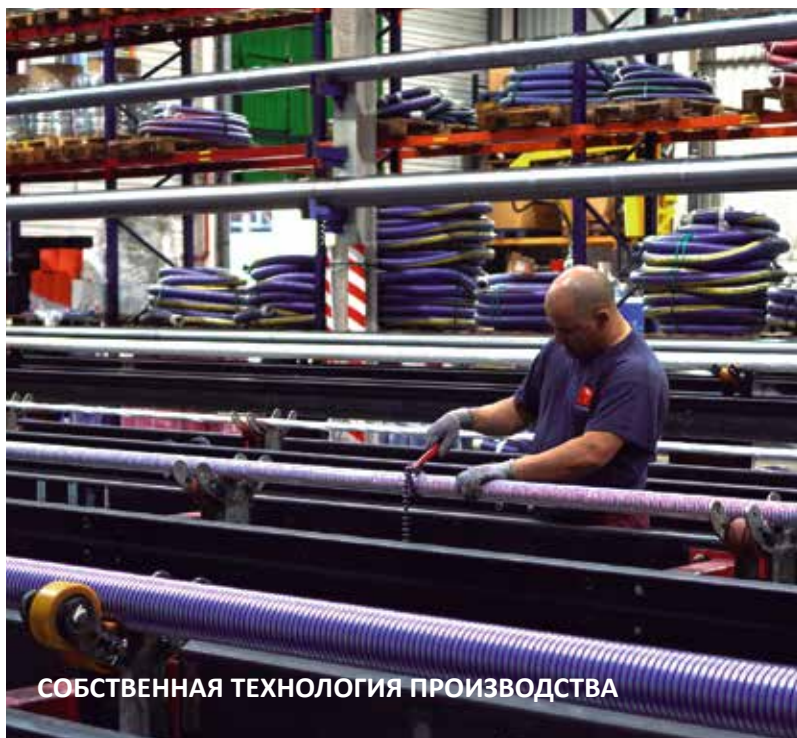
СОБСТВЕННАЯ ТЕХНОЛОГИЯ ПРОИЗВОДСТВА